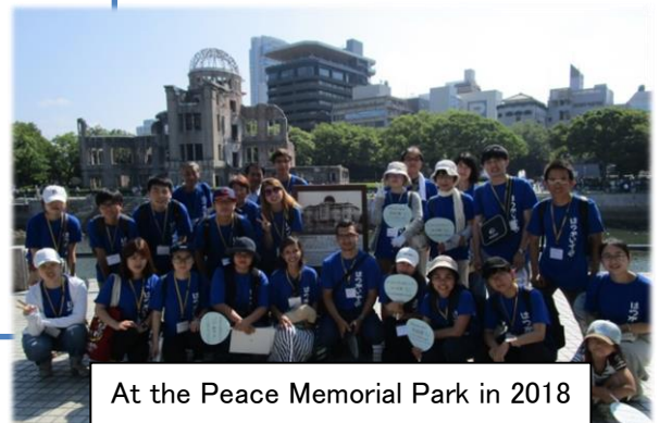
At the Peace Memorial Park in 2018 (11 countries ・ 19 Participants)