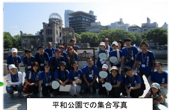
平和公園での集合写真 昨年の参加者(11ヵ国・19人)